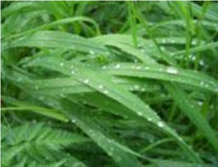
Tau auf Gras

Gras und Kräuter gedeihen in diesem Land, da es an der Grenze zum Waldland liegt. Große Teile der ursprünglichen Waldlandschaft wurden durch den Menschen zerstört; hier haben sich ein- und mehrjährige Kräuter und Gräser entwickeln können.