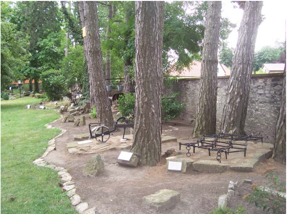
Alte Ackergeräte im Schatten der Schwarzkiefern

Du feuchtest die Berge von oben her, du machst das Land voll Früchte, die du schaffst. Du lässt das Gras wachsen für das Vieh und Saat zu Nutz den Menschen, dass du Brot aus der Erde hervorbringst, dass der Wein erfreue des Menschen Herz und sein Antlitz schön werde vom Öl und das Brot des Menschen Herz stärke. Die Bäume des Herrn stehen voll Saft, die Zedern des Libanon, die er gepflanzt hat.