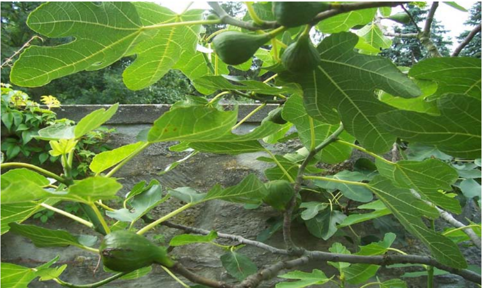
Feigenbaum mit Früchten

In unserem Bibelgarten sind neben den heimischen Obstbäumen wie Aprikosenbaum, Walnussbaum oder Weinrebe der Granatapfel, der Feigen- und Maulbeerbaum sowie Oliven- und Zitrusbäume zu finden.