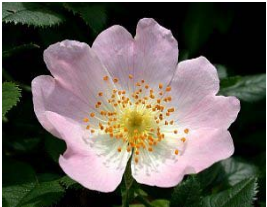
Blüte der Hundsrose

Evangelisches Gesangbuch 512 Heinrich Puchta, 1843