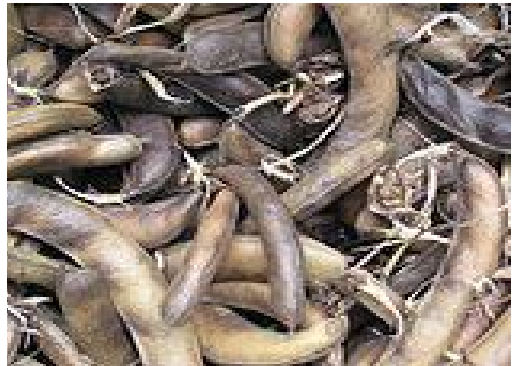
Hülsenfrucht der Puffbohne